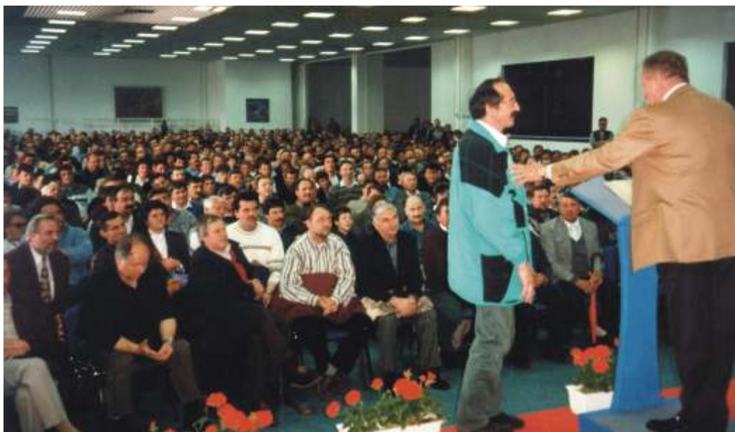
Pogoji za pridobitev licence so bili leta 1998 tema, ki je močno razburkala avtoprevozniško javnost. Več kot tisoč prevoznikov se je tedaj zbralo na celjskem sejmišču, da bi oblasti sporočili, da jim njene rešitve niso v prid.

ostale sekcije pa so manjše. Vsaka je seveda zgodba zase; ene so bolj aktivne, saj imajo več problemov (in bolj zagnano vodstvo), druge manj. Vseh seveda ne moremo podrobneje predstaviti, nekaj pa jih vseeno.