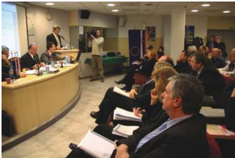
19. december 2007 se je v zgodovino zapisal kot ustanovni dan Obrtno-podjetniške zbornice Slovenije

Februarja 2008 se je upravni odbor OZS soočil z delodajalskimi temami oziroma z izplenom