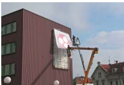
Znak z novim imenom zbornice je dobil svoje mesto tudi na pročelju osrednje zbornične poslovne stavbe na Celovski cesti v Ljubljani

Na začetku leta 2008 so se ponovno razplamtele zahteve o vrnitvi olajšav za naložbe, ki so bile ukinjene konec leta 2006, saj delne rešitve