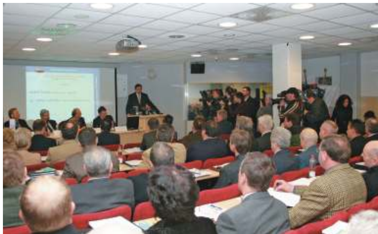
Vladne ukrepe proti krizi sta prišla na skupščino OZS konec leta 2008 pojasnjevati predsednik vlade Borut Pahor in gospodarski minister dr. Matej Lahovnik .

pakete ukrepov). Tudi nova vlada, ki je dovolj hitro spoznala, da prav obrtniki in mala podjetja predstavljajo ogromno večino (98 odstotkov) gospodarskih subjektov v Sloveniji (podobno pa tudi v Evropski uniji) in da torej prav ta podjetja potrebujejo takojšnje ukrepanje, je hitro prisluhnila predlogom obrtnikom in njihovim zahtevam. Decembra 2008 se je predsednik vlade Borut Pahor z gospodarskim ministrom dr. Matejem Lahovnikom udeležil poslanske skupščine OZS. Obrtnikom je zagotovil, da bo vlada storila vse, kar je mogoče, da bi Slovenija prebrodila krizo s čim manjšim negativnim vplivom na gospodarstvo. Oba čelna moža OZS pa sta poudarila, da je zbornica med ukrepi za blažitev posledic finančne krize od vlade pričakovala, da bo zagotovila tudi poravnavanje vseh njenih obveznosti do dobaviteljev in izvajalcev del ter storitev v roku 30 dni.