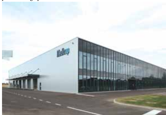
Novi kar 7,5 milijonov evrov vredni poslovni in proizvodni prostori podjetja Medicop so trenutno največja investicija v pomurskem gospodarstvu.