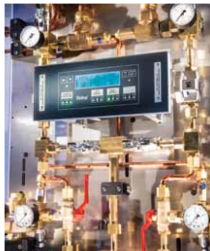
Inovativnim in kompleksnim rešitvam medicinske opreme podjetja Medicop zaupajo na več kot 60. trgih po vsem svetu.