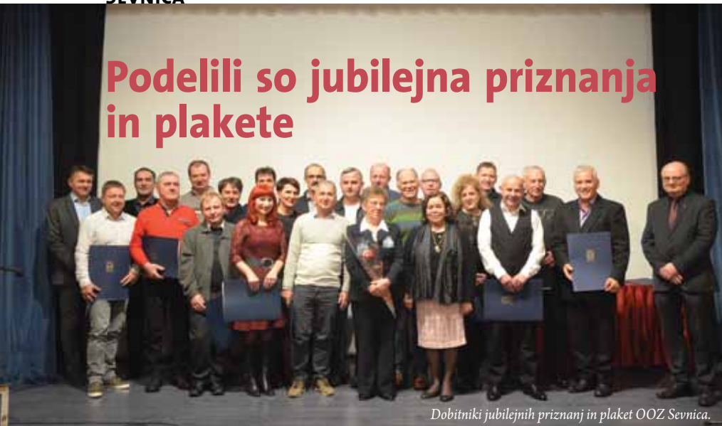
Dobitniki jubilejnih priznanj in plaket OOO Sevnica.