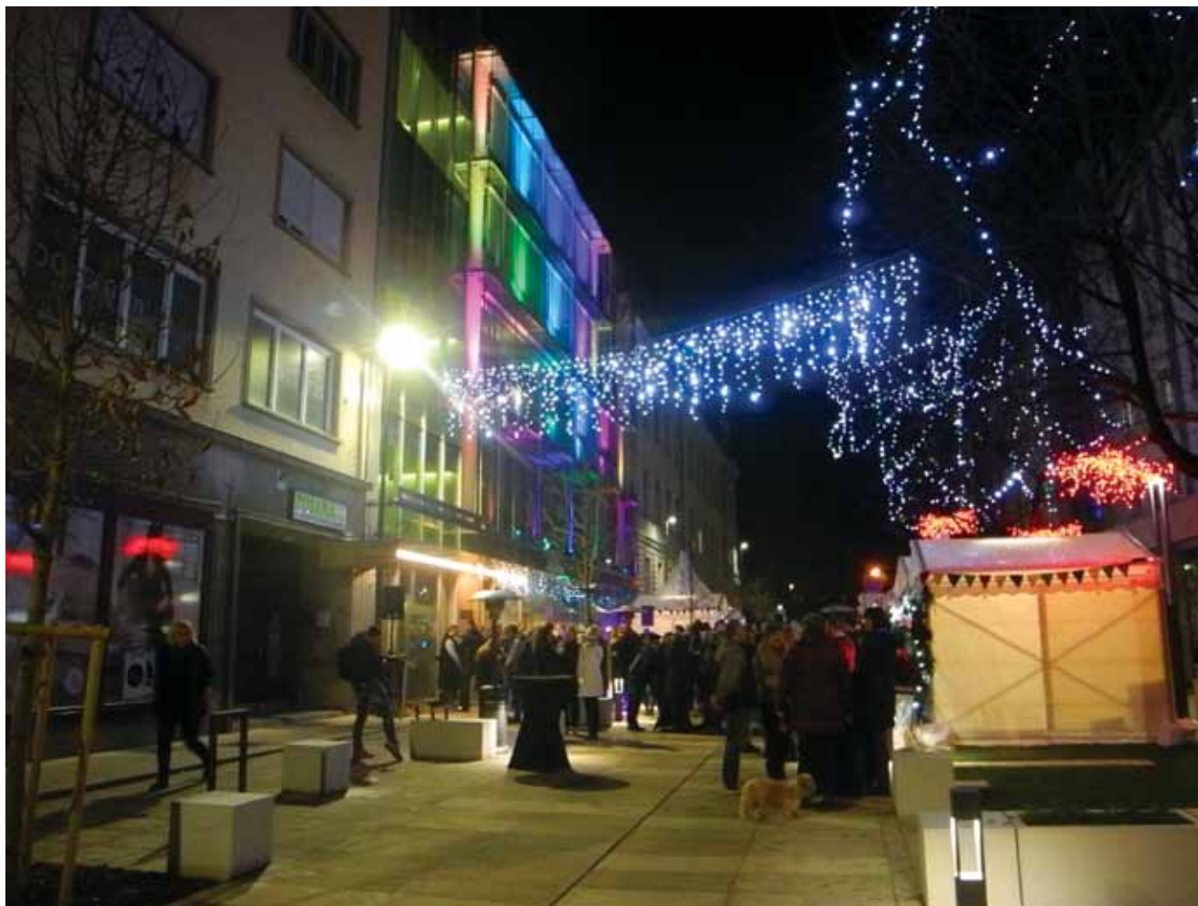
Cafoodfest in praznično okrašena prenovljena Cafova ulica v Mariboru.

Študentje so postregli tudi z mlečnim kruhom in domačo marmelado.