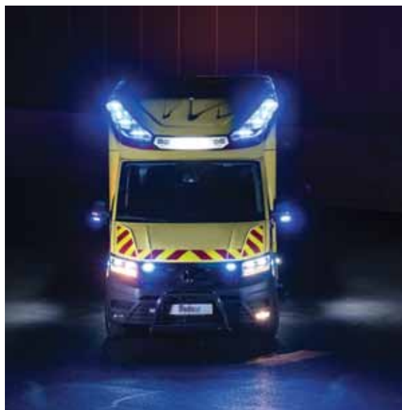
Lastni razvojni center podjetja Medicop zagotavlja neodvisen razvoj tehničnih izboljšav, novosti in visokih standardov specifičnih potreb kupcev njihovih reševalnih vozil.