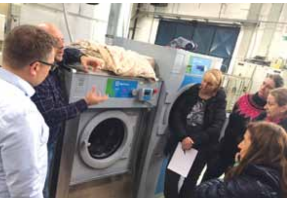
Udeleženci strokovne delavnice so spoznavali tudi praktične rešitve mokrega čiščenja.

Sekcija vzdrževalcev tekstilij pri OZS je v sodelovanju z izobraževalnim centrom Labod za svoje člane ter predstavnike pralnic bolnišnic in domov za upokojece organizirala delavnico Postopek mokrega čiščenja Lagoon advanced care 2.0.