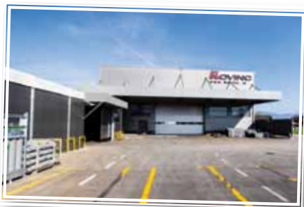
Na svojo zadnjo pridobitev, proizvodno halo v velikosti dva tisoč kvadratnih metrov, ki so jo postavili pred dvema letoma, so zelo ponosni, zgledna proizvodnja pa jim pomaga tudi pri pregledih naročnikov iz tujine, ki jih ti opravijo pred večjimi naročili.