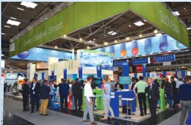
Uspešna skupinska predstavitev slovenskega gospodarstva na sejmu Transport & Logistic v Münchnu. Na skupnem razstavnem prostoru se je uspešno predstavilo 19 slovenskih podjetij in institucij iz logističnega in transportnega sektorja.