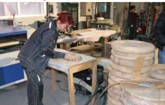
V podjetju Kendales se ukvarjajo s serijsko proizvodnjo večinoma stolov in miz.